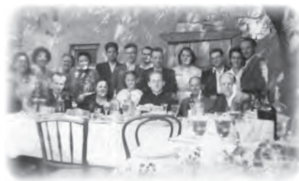
Újmiséma utáni agapé családi körben

Az újmisémet Almásfüzitőn mondtam, egy kis iskola-helyiségben, mert nem volt templom. Szinte az egész település ott szorongott, velem imádkoztak. Elmondhatatlan, életre szóló élmény ez. Megáldottam a szüleimet, és el is sírtam magam. Többféle érzés kavargott bennem: hála, köszönet, boldogság, szeretet. Eszembe jutott a háború, a szovjet hadifogság, hogy túléltem minden megpróbáltatást, s végül mégiscsak pap lehettem.