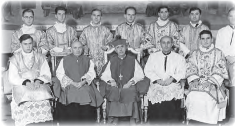
A papi élet kezdete...

Pappá szentelésem előtt Vácra mentem, hatnapos lelkigyakorlaton vettünk részt. Talán mondhatom, hogy ezek a csodálatos napok a végsőkig elmélyítették Isten iránt érzett szeretetemet. Mindig éreztem, hogy a Gondviselés velem van, figyeltem a jelekre. Előfordult, hogy bent voltam egy épületben, odakint zuhogott az eső. Kiléptem, és elállt, amikor visszamentem, újra elkezdett esni. S én boldog voltam, hogy a jó Isten a tenyerén hord.