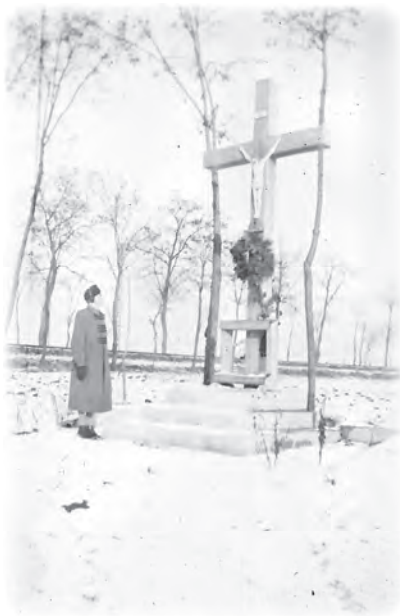
Hálaadás az almásfüzitői feszület előtt

gus. Ugyanezen a napon este Naszályon is celebráltam újmisét, s itt mondtam el az első önálló homíliámat, Jézus Szívéről. Édesanyám szerint ez volt az egyik legjobb beszédem.