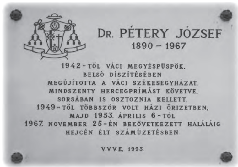
Emléktábla a váci püspöki palota falán