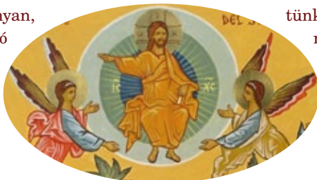
május 29: Jézus mennybemenetele

Jézust ők egyszer már elvesztették. Irtózatossá élmény lehetett számukra a nagypéntek. Az alatt az idő alatt, ami Jézus feltámadása és mennybemenetele közé esik, újra erőre kapnak. Végül Jézus egyszer s mindenkorra eltávozik (testileg), és egyedül maradnak. Lehet-e ilyen nagy próbát kétszer kiállni?