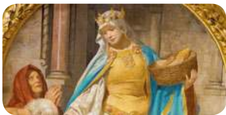
November 19-én ünnepeljük Árpád-házi Szent Erzsébetet