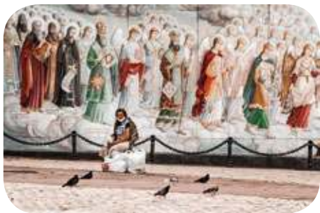
November 13: Szegények világnapja

Hübner nevét sokan ismerjük az első magyar hittankönyvről, amely 1740 körül jelent meg magyarul. Róla jegyezték fel: nagyon szegény lelkész volt, és egyszer a barátja levélben jelezte: rövidesen látogatóba érkezik hozzájuk. A felesége összecsapta a kezét: „Angyalom, semmink sincs itthon! Micsoda szé- ➤