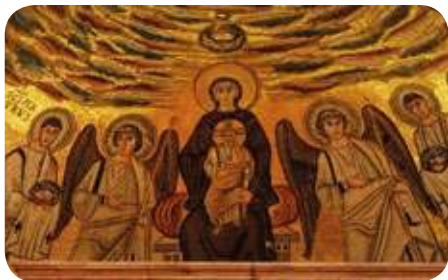
Aug. 15: Nagyboldogasszony ünnepe

Ebben a ködbe vesző régi időben került nyelvünkbe az alán eredetű asszony